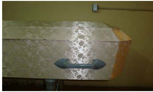
ATAÚD DE MADERA OCHAVADO INFANTE, PARTIDAS 2, 3, 4 y 5, DEL PAQUETE 2